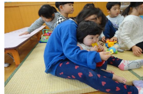
だいすきな♡おにいちゃんと おねえちゃんといっしょ