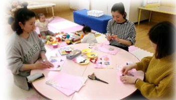
ひな飾りの制作中・・・！