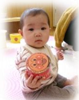
アンパンマンと一緒によ♡