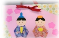
こんな感じ♡ 見本です！