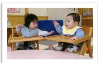
イスに座って、おやつを食べたよ！