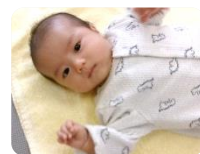
一緒に遊びたいな～♪