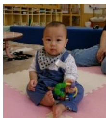
ちょっと、緊張・・・