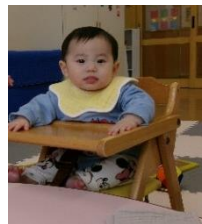
座るの 上手でしよう!