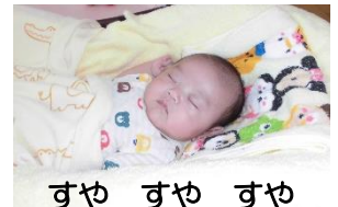
すや すや すや