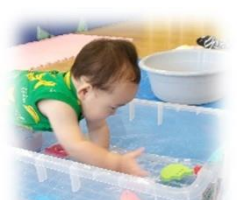
お水、 パシャパシャ