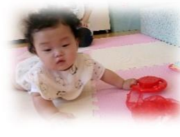
どれで遊ぼうかな?